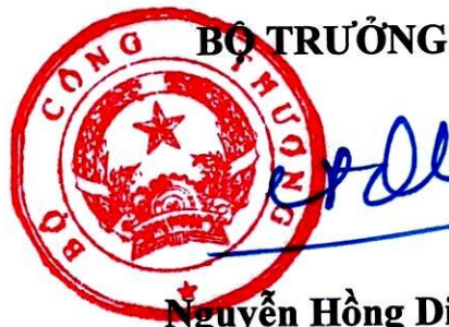
Nguyễn Hồng Diên