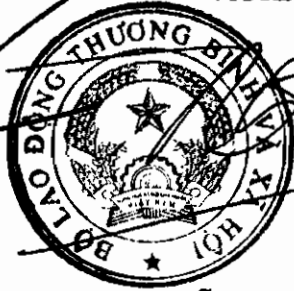
Nguyễn Thị Kim Ngân