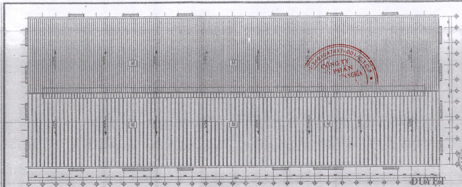
MẶT BẰNG MÁI - TL: 1/200

Bản vẽ kèm theo Giấy phép Xây dựng Số: 22/JGXD Ngày 21 tháng 5 năm 2014 BAN QUẢN LÝ CÁC KCN ĐỒNG NAI