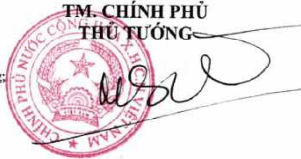
Phạm Minh Chính