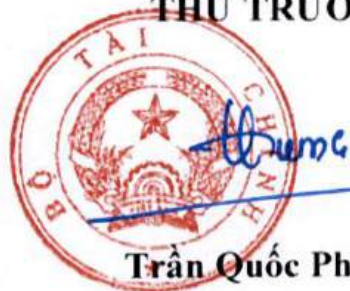
Trần Quốc Phương