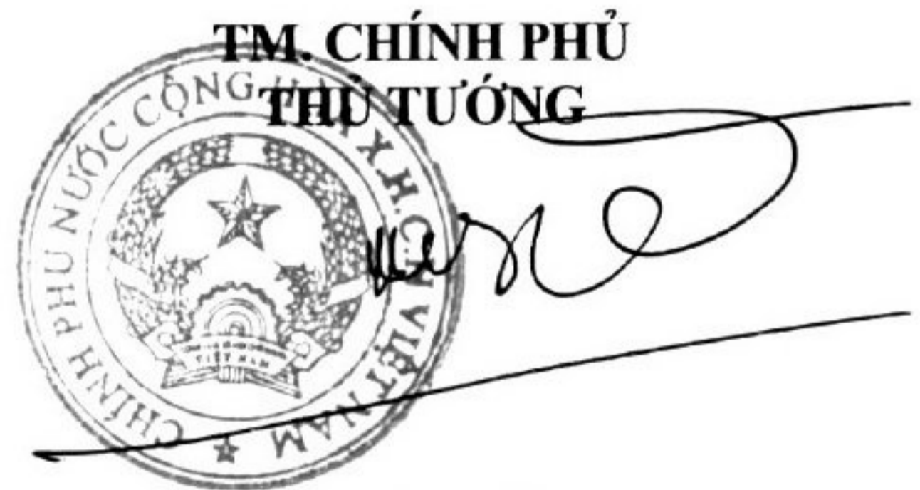
Phạm Minh Chính