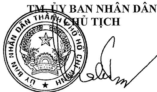
Nguyễn Thành Phong

2. Trong quá trình triển khai thực hiện Quy định này, nếu có vấn đề phát sinh hoặc vướng mắc, xét thấy cần thiết, kịp thời phản ánh về Ủy ban nhân dân thành phố (thông qua Sở Nội vụ) để sửa đổi, bổ sung cho phù hợp với yêu cầu thực tiễn và quy định pháp luật hiện hành./.