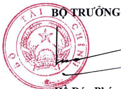
Hồ Đức Phúc