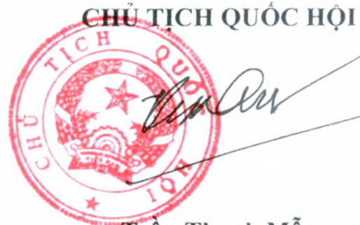
Trần Thanh Mẫn